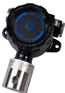
Geopal GJ-EX Gasdetektor for installation i zone 1 & 2. ATEX certificeret