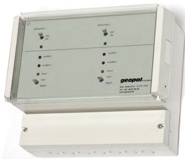
Geopal GJD-04C Dual line alarmcentral for tilslutning af to detektorer