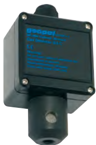
Geopal GJ-C Gasdetektor for installation i uklassificerede områder