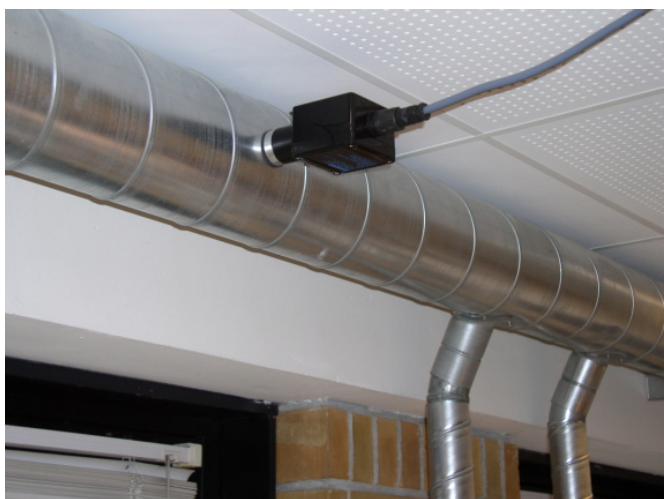
Eksempel på kanalmontage med GP-CO2 detektorer

GP-CO2 kan ligeledes leveres for kanalmontage. Leveres med DIN-stik for enkel montage/demon-tage.